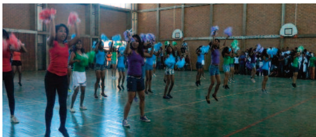
Les pom pom girls...