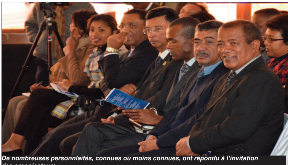
De nombreuses personnalités, connues ou moins connues, ont répondu à l'invitation des organisateurs.